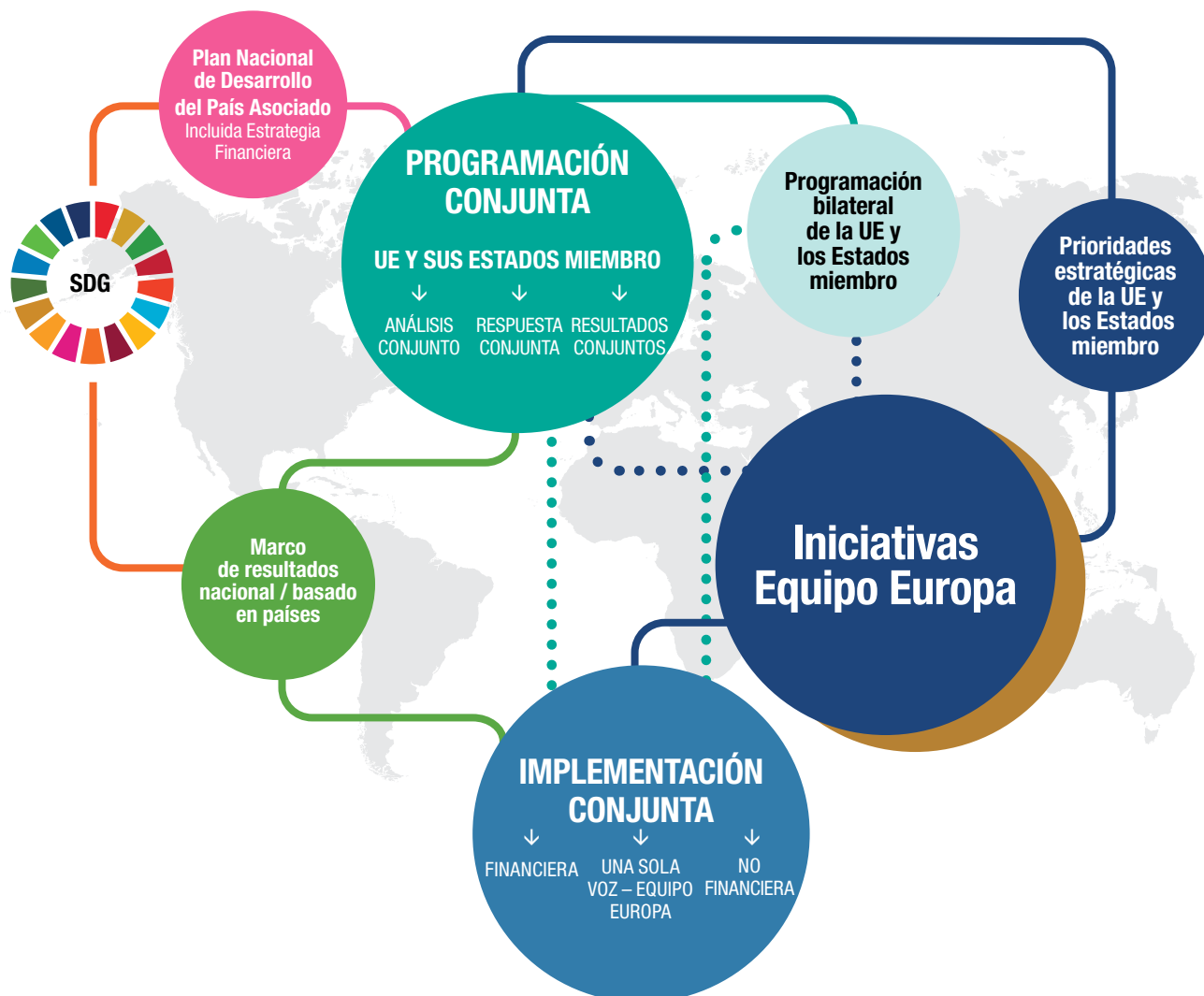
Gráfico 2: Diagrama extraído de la guía “Trabajar conjuntamente como Equipo Europa” (enero de 2021)

La estrategia Equipo Europa está constituida por: las instituciones y servicios de la UE (incluidas las Delegaciones de la UE), los Estados miembros de la UE (incluidas sus agencias y bancos públicos de desarrollo), el Banco Europeo de Inversiones (BEI) y el Banco Europeo de Reconstrucción y Desarrollo (BERD).