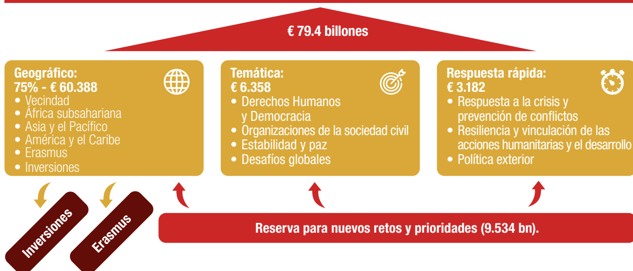
Gráfico 3: ¿Cómo se estructura Europa Global?

El componente temático es complementario del componente geográfico y es programable.